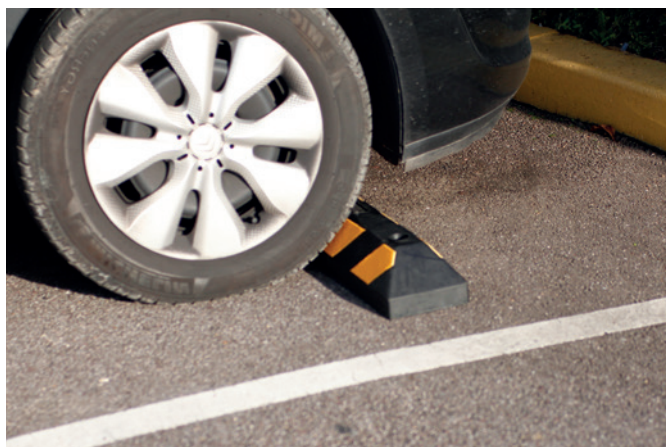
Nr kat. 207912